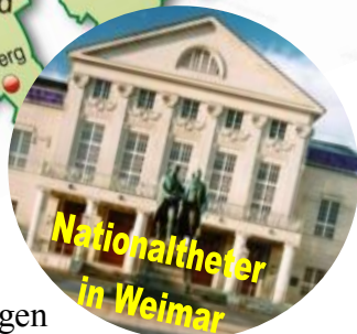
Nationaltheater in Weimar

Land: Deutschland Bundesland: Thüringen Die erste Erwähnung: 1250 Fläche: 84,26 km 2 Einwohnerzahl: 65176 Persönlichkeiten: F.Schiller, J.W.von Goethe, J.G.Herder, J.S.Bach Sehenswürdigkeiten: Schiller-Goethe-Haus, Goethe-Schiller-Denkmal, Gartenhaus, Schlosspark, Nationalpark, Nationaltheater.